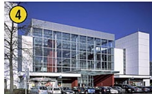
Technisches Rathaus Gustav-Heinemann-Straße 10 Tel.: 0 23 81 / 17 - 0 Öffnungszeiten Bautechnisches Bürgeramt: Mo – Do: 7.30 – 16.00 Uhr Fr: 7.30 – 12.30 Uhr