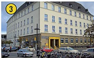
Hauptpost Deutsche Postbank AG Willy-Brandt-Platz 2 Tel.: 0 23 81 / 92 43 80 Öffnungszeiten: Mo – Fr: 8.00 – 18.30 Uhr