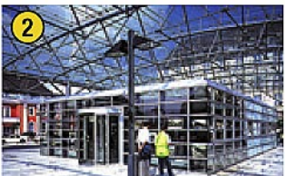
Verkehrsverein / Info insel Willy-Brandt-Platz Tel.: 0 23 81 / 2 34 00 Öffnungszeiten: Mo – Fr: 8.00 – 19.00 Uhr Sa: 9.00 – 18.00 Uhr