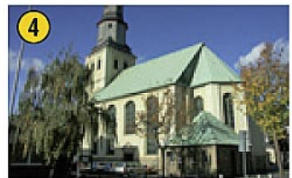
Evangelische Lutherkirche Martin-Luther-Platz Tel.: 0 23 81 / 14 21 59 Gottesdienst: Sa 18.00 Uhr geöffnet nur während des Gottesdienstes