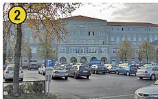
St.-Marien-Hospital Nassauer Straße 13 – 19 Tel.: 0 23 81 / 18 - 0 www.marienhospital-hamm.de