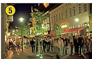
Südstraße "Meile" Erlebnis-Gastronomie