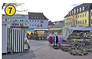
Marktplatz Wochenmarkt Di und Do: 8.00 – 13.00 Uhr Sa: 8.00 – 13.30 Uhr